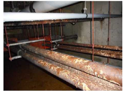
電気幹線配管 電線管腐食 (漏電による全館停電の危険性)

※7「DB (Design-Build) 方式」…設計（基本設計・実施設計の両方もしくは実施設計のみ）と、建築工事を同一の事業者が一括で行う整備手法のこと。